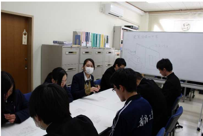
【建築科建築設備コース生徒から土木科生徒への依頼】