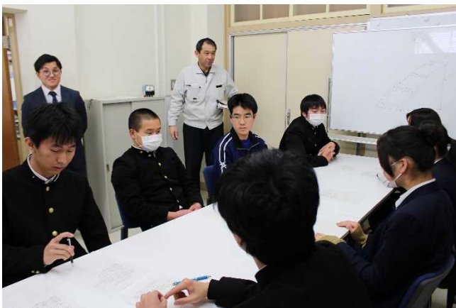
【電気科生徒から機械科生徒への依頼】