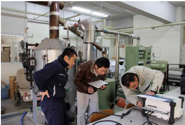
【電気融着機操作指導風景】