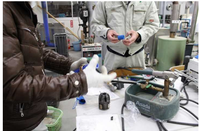
【耐圧試験機操作指導風景】