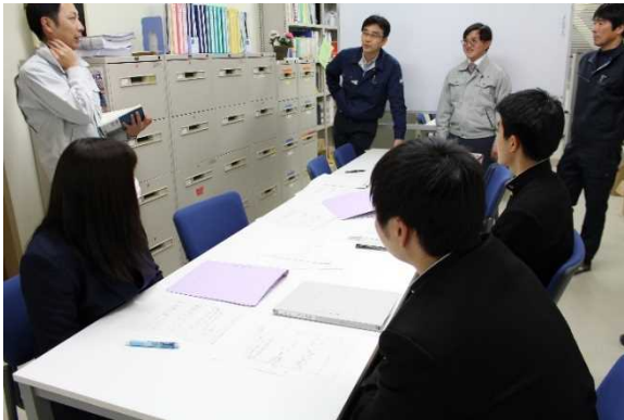
【電気科生徒から土木科生徒への依頼】

先回の打ち合わせで、建築科建築設備コースからエコハウスに電気を通す依頼を受け、電気科で検討した結果電線管を埋設する溝を掘削する作業が必要になり土木科に依頼した。