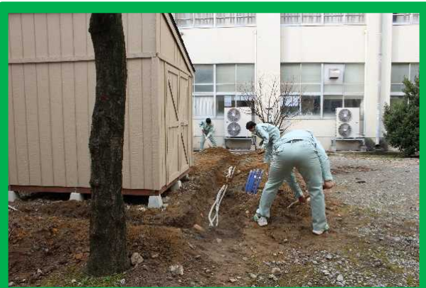
【電気科生徒による電線敷設工事】

打合せから施工までの協働のスピード感が感じられた。引き続き電気科で電源工事を行って行く。次回は地中熱エアコンの設置工事を建築科建築設備コースが担当する。