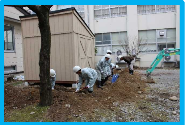
【土木科生徒による掘削工事】