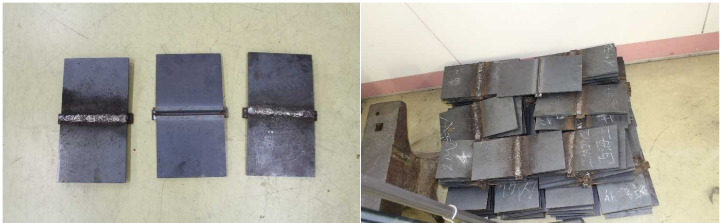
「全員がプロフェッショナルから指導を受け溶接を行った」

機械科 2 年生 76 名が新潟造船の溶接センターで、造船工場のプロフェッショナルから直接技術指導を受けました。