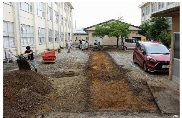
【土木科の研究風景】