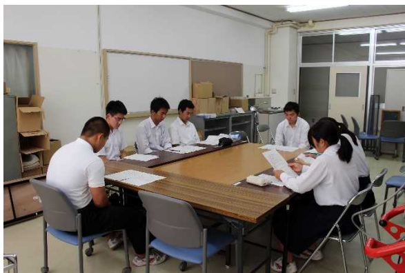
【生徒間での話し合い風景】

建築科（設備） → 工業化学科に地中熱配管内に不凍液を月曜午後に充填したいので不凍液の濃度調節と充填作業を手伝ってほしい。