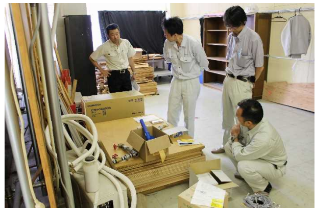
【機器現物確認と指導方法の検討風景】